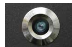
Linse Schutzklasse IP65