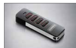
Pearl 4-Befehl Handsender