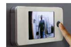
Aufgesetzt für ST

DE-DE - 05/19 Druckfehler, Irrtümer und Technische Änderungen vorbehalten.