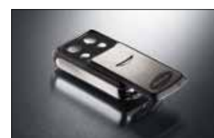
Slider 4-Befehl Handsender